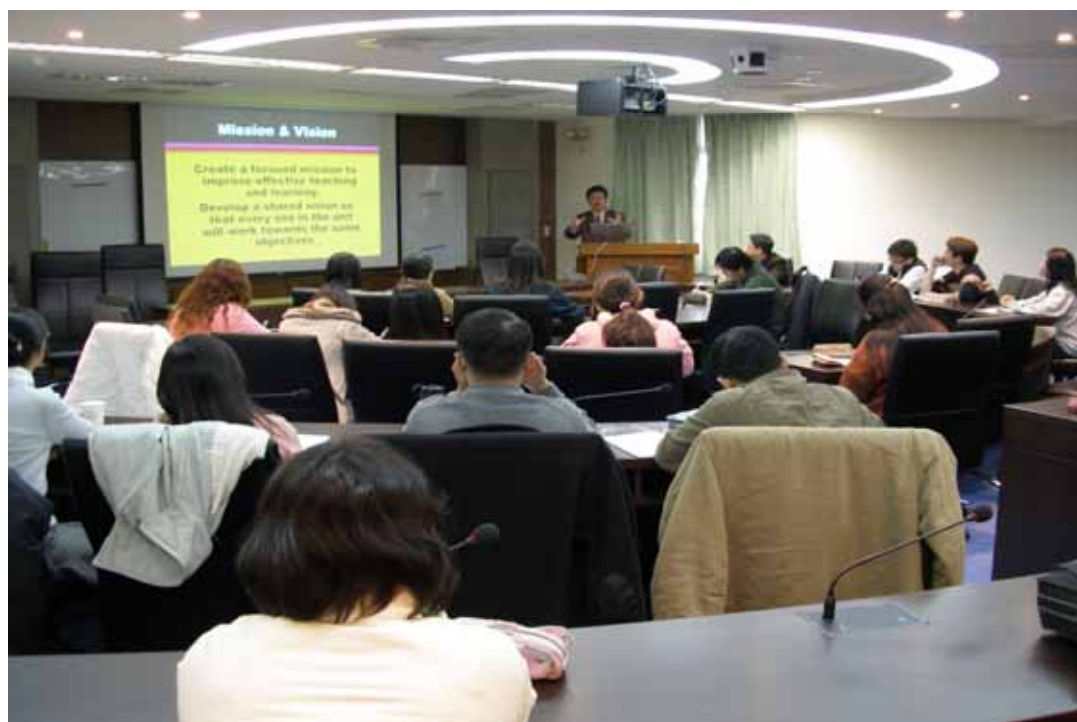
大家都認真的在作筆記喔…