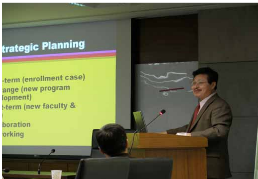
萬教授的風采迷人…